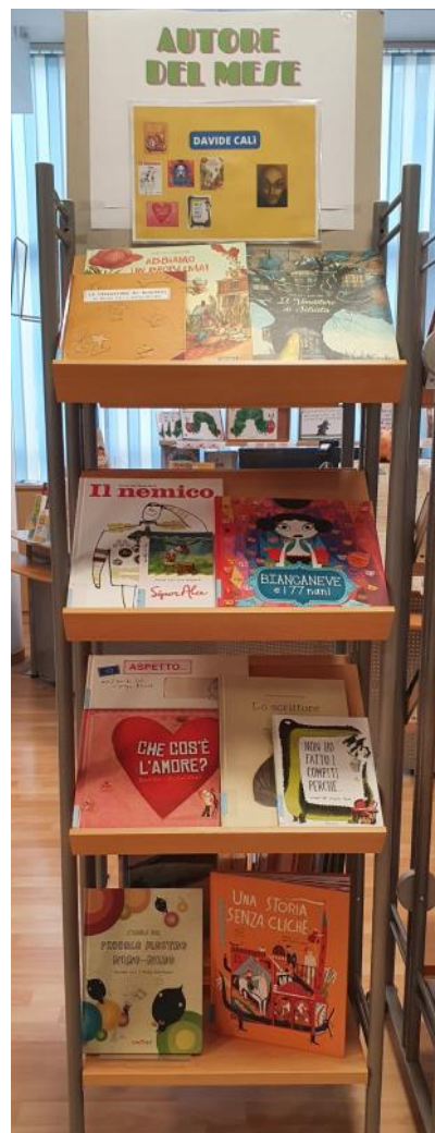
Alcune foto sono state tratte dal web

...e altri! Nella nostra biblioteca abbiamo in totale 20 libri di Davide Calì!